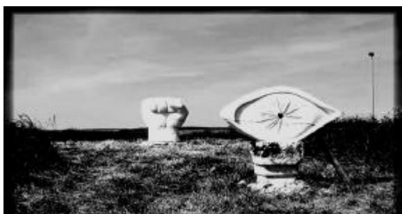
Beide Widerstandsskulpturen haben offizielle Stellen inzwischen zerstören lassen.