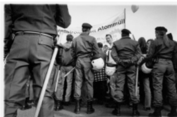
Fotos: Kirchheim/N. 1998: Demonstration für den sofortigen Atomausstieg

Der beschleunigte daraufhin seinen Gesetzeslauf. Das Märchen vom Atomausstieg wurde vollendet. Wer dran glaubt ist selig. Alle anderen Blockieren weiter.