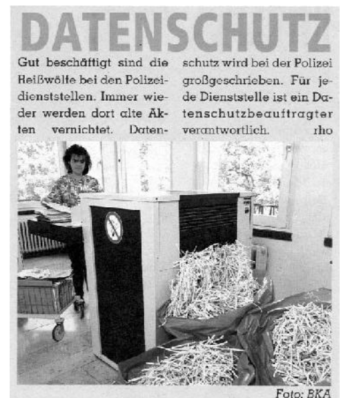
(aus „Sicher Leben“, Hrsg.: LKA BaWü)

fährlichkeit“ im strafrechtlichen Sinn zu unter- stellen und ohne Rechtsgrundlage durchge- führte Verbote und Ingewahrsamnahmen zu rechtfertigen. Die Aufnahme in eine der Polizei- dateien erfolgt bereits, wenn beispielsweise ein Atomkraftgegner/in in eine Personenkontrolle anlässlich eines Atommülltransportes gerät. Es muss weder eine begangene Ordnungswid- rigkeit, geschweige denn eine Straftat vorlie- gen.