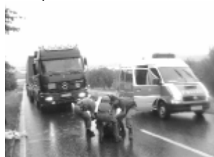
1.7.03: „Kein Stop des Transports“ (Polizei-Presse-Info)